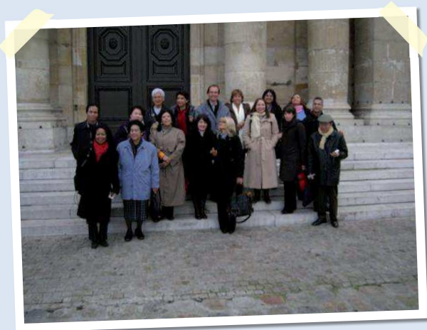
Les participants devant L'Institut de France

Toucher du doigt les symboles culturels français : Institut de France, Le Louvre, Versailles et La Comédie française