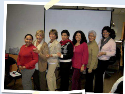
Pause bien méritée