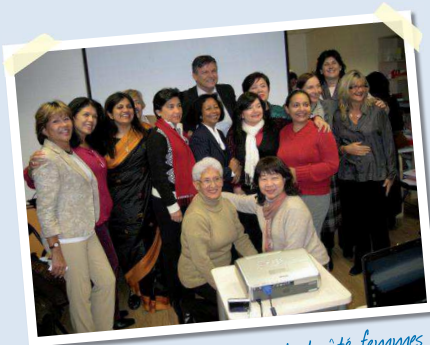
Le président côté femmes