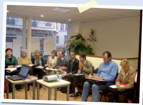
Exposé des partenaires