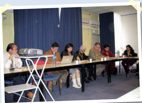
Une vue des participants.