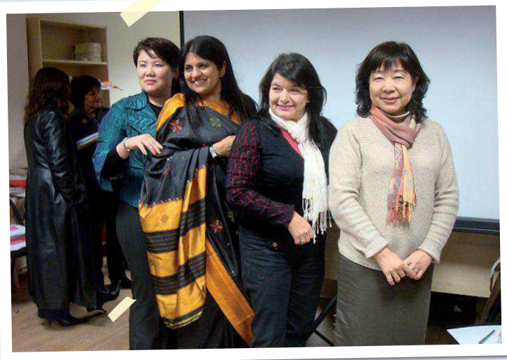
Les participants à la pause