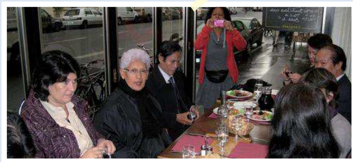
Les participants au Quartier Latin.

Ambiance bonne enfant pour créer du lien