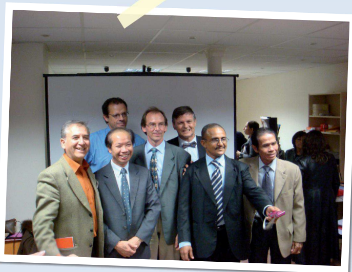
Bonne humeur, le maître mot de la semaine