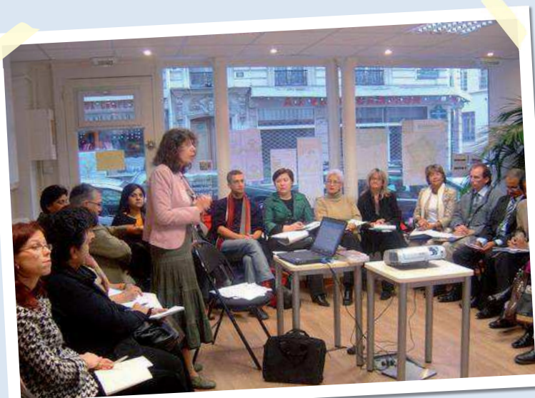
Participants attentifs et détendus.

Connaître les ressources pédagogiques des partenaires