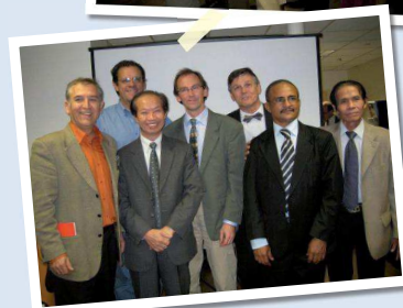
Le Président côté hommes