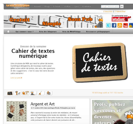
Page d'accueil de lewebpedagogique.com

de socialisation et selon certains certaines de nos facultés cognitives. Il est donc important de former les futures générations en intégrant cette dimension dans leurs parcours. Il ne s'agit pas de remplacer le présentiel, il s'agit de former des citoyens afin qu'ils ne soient pas des analphabètes numériques. J'ai donc quitté le monde de l'édition scolaire pour innover et trouver, je l'espère, des éléments de réponses à ce défi.