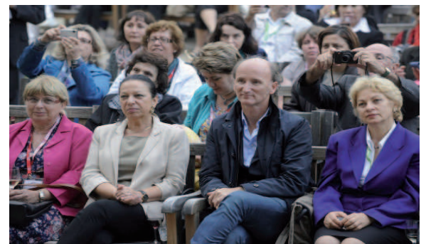
Un moment de convivialité inoubliable.