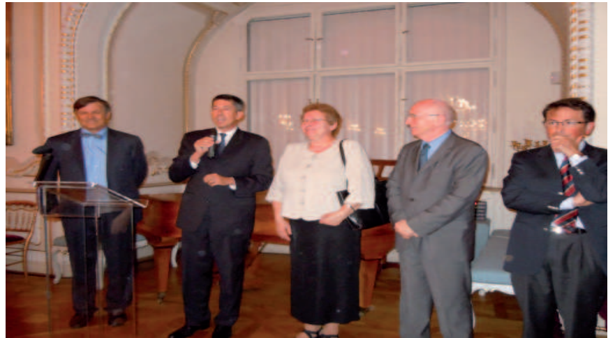
Comme à l'occutumée, les professeurs des associations du réseau FIPF ont été invités à la Résidence de Monsieur Pierre Levy, Ambassadeur de France en République tchèque pour un cocktail de bienvenue.