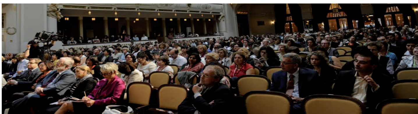
L'assemblée encore assidue à la clôture du congrès.