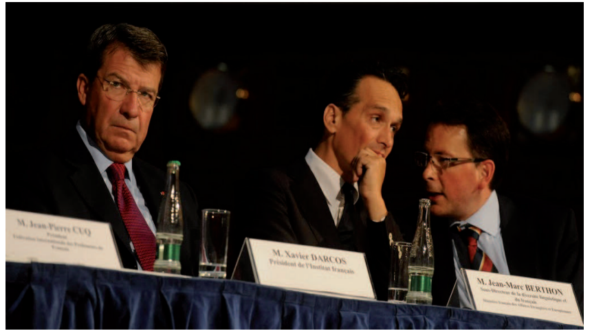
M. Darcos, Président de l'Institut français