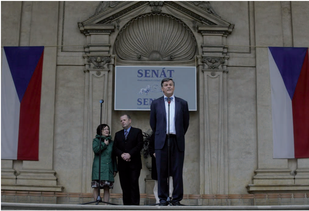
Les participants au congrès ont été conviés à une soirée dans les Jardins du Sénat à Prague.