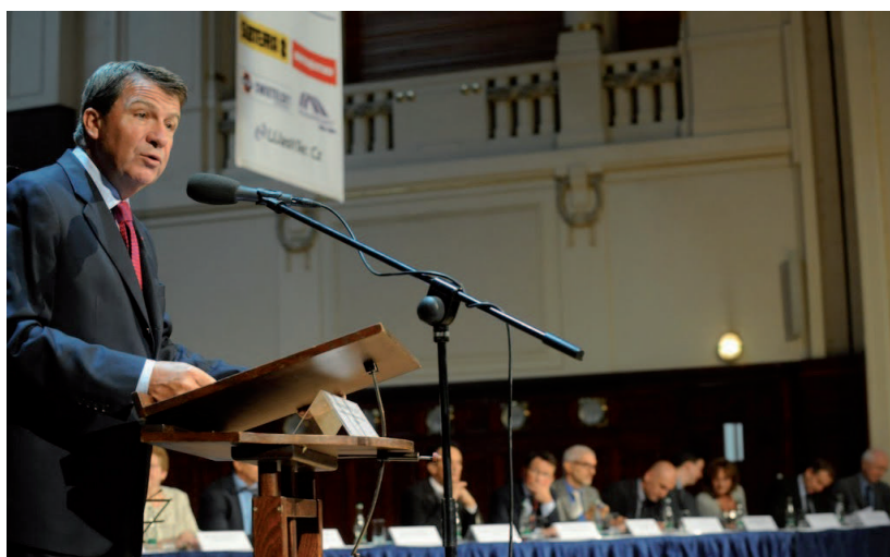
M. Xavier Darcos, Institut de français

La FIPF a tenu son 2 ème congrès européen du 8 au 10 septembre 2011 à Prague. Celui-ci a été organisé par l'association des enseignants de français de la République tchèque (SUF), en collaboration avec la FIPF et ses deux commissions européennes, la CEO et la CECO. L'ouverture et la clôture du congrès se sont déroulés dans un lieu prestigieux: la Maison Municipale de Prague: Obecní dum, monument capital du courant architectural Art Nouveau. La séance d'ouverture a débuté par l'allocution de M. Xavier Darcos, Président de l'Institut français (le nouvel opérateur du Ministère français des affaires étrangères et européennes), venu expressément pour la signature du partenariat IF-FIPF (voir article p. 1 de ce bulletin). D'autres personnalités ont prononcé leurs discours de bienvenue: notamment les représentants de l'OIF, de la DGLF-LF et de l'Ambassade de France à Prague, ainsi que les représentants tchèques du Ministère de l'éducation nationale.